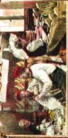
SCÈNE DE CUISINE