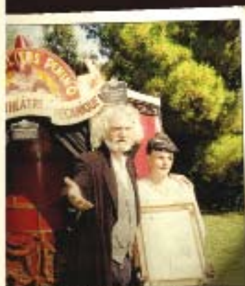
Ateliers Denino™ vous accueille dans son l'italienne miniature.