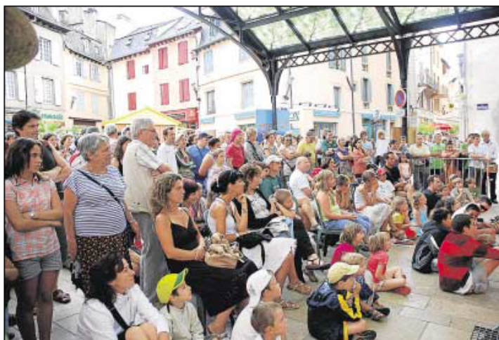
Sous la halle au Blé, comme partout ailleurs en ville, le public au rendez-vous.

Le sac fatal du festivalier , bien, devait ressembler à celui de l'inspecteur Gadget : une ombrelle pouvant se transformer en parapluie, un pull imperméable, un programme pouvant servir soit de chapeau contre le soleil, soit de protège-pluie... Pour autant, la météo incertaine n'a pas arrêté le public qui s'est pressé nombreux à toutes les représentations. Seul le stress des organisateurs est monté en flèche devant les caprices du baromètre. Et d'une scène à l'autre, d'un spectacle à un autre, les spectateurs, bien souvent venus en famille, se sont régals. Comme toujours pour 48 e de rue, qualité, humour et talent étaient au rendez-vous. Un conseil pour aujourd'hui : précipitez-vous pour réserver les spectacles à petite jauge (maison du festival) et ne manquez pas Les Fillharmonie von Strasse : unanimité à la sortie !