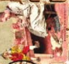
SCÈNE DE CUISINE