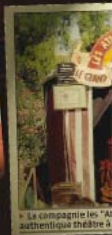
La compagnie les "Ateliers de la Compagnie" authentique théâtre à