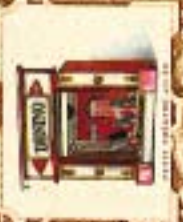
SCÈNE DE CUISINE