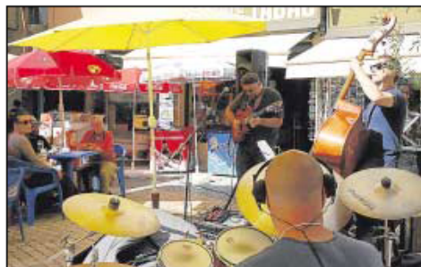
Gas Swingue place René-Espinas avec la compagnie Échos et 'Irakli & Yaki'.