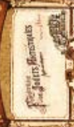
SCÈNE DE CUISINE