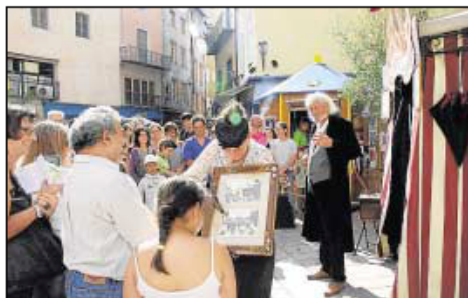
Le Grand Théâtre menaquiné, place de la République.