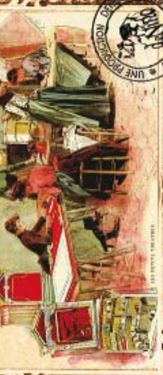
SCÈNE DE CUISINE