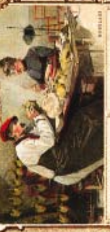
SCÈNE DE CUISINE