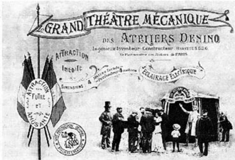
Cette attraction foraine était tombée dans l'oubli pour finir dans une grange à prendre la poussière